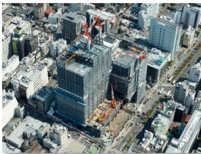
航空写真（南西方向より）

地上18階（最上階）までの鉄骨工事が完了し、4月末時点で予定通り上棟しました。外装工事に続き、今年より商業・業務棟及び公共・公益棟の内装工事にも着手しております。