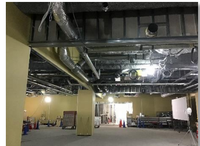
商業エリア内装設備工事状況