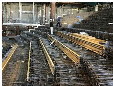
公共施設（大ホール部分） 段床工事状況