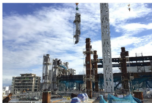
地上部鉄骨工事状況