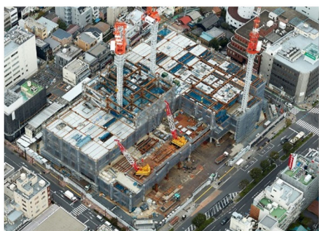
航空写真(南西方向より)

10月現在で7階部分までの鉄骨工事を進めており、外部からも建物が立ち上がっている様子が随分と見えてきました。鉄骨工事と合わせて順次梁や床等の配筋(躯体工事)を進め、コンクリートを打設しています。また、地下では地上の作業と並行して掘削工事や躯体工事を進めています。なお、12月からは建物の外装材の取り付けにも着手する予定です。