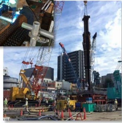
↑構真柱の設置状況