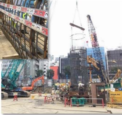
↑鉄筋かごの設置状況